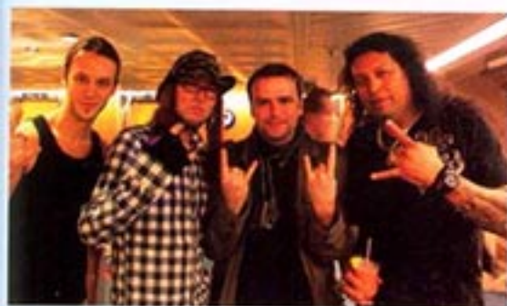
Je loopt ze aan boord zo tegen het lijf: Mark Jansen, Warrel Dane, Hansi Kürsch en Chuck Billy.

van zijn bemanning ook metalfan is. Hij moest wennen aan de stoere outfits die iedereen droeg, maar kwam er tijdens de cruise achter dat in die stoere outfits een zachte kern huist. Er zijn totaal geen problemen aan boord geweest en alles is zeer vreedzaam verlopen."