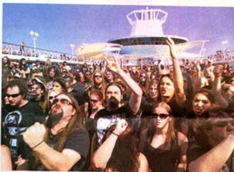
Neues Terrain: Fans beim Konzert auf der „Majesty of the Seas“.

hat der Musikmanager auf dieses Festival hingearbeitet. Er saß in seinem Apartment in Vancouver, sah die Kreuzfahrtschiffe ein- und auslaufen, hatte ein Bier zu viel getrunken und plötzlich einen Traum: Traumschiff trifft auf Heavy Metal.